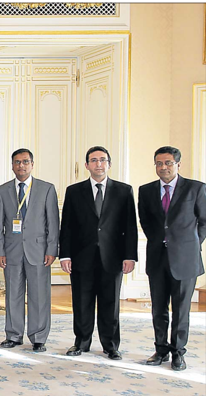
genommen haben.

„Wenn wir davon ausgehen, dass dieses Jahrhundert, das das der Schwellenländer sein wird, dann glaube ich, dass dieses Jahrhundert auch das der islamischen Finanz sein wird“, so Ahmed.