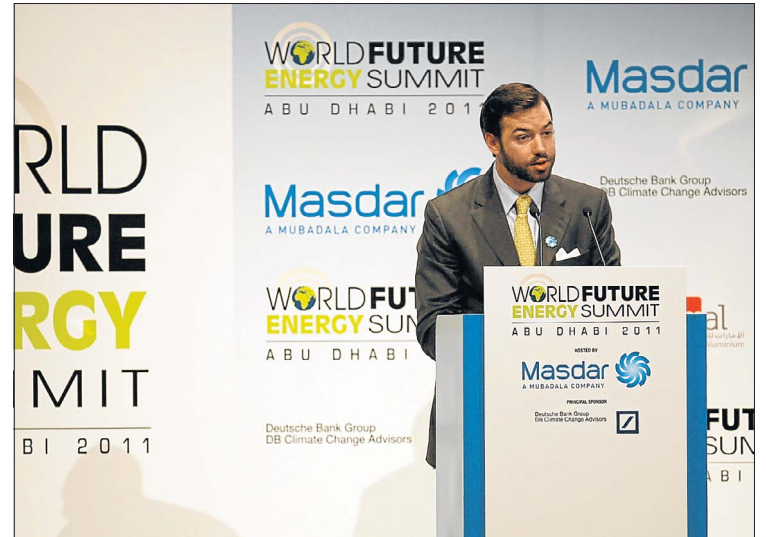
Erbgroßherzog Guillaume hatte die Ehre, als einer der Hauptredner die Messe zu eröffnen und Luxemburg zu präsentieren.

Neben den Unternehmen fördert das Wirtschaftsministerium die wissenschaftlichen Einrichtungen. Die Universität Luxemburg und das CRP Henri Tudor präsentieren die verschiedenen Bereiche der Forschung „made in